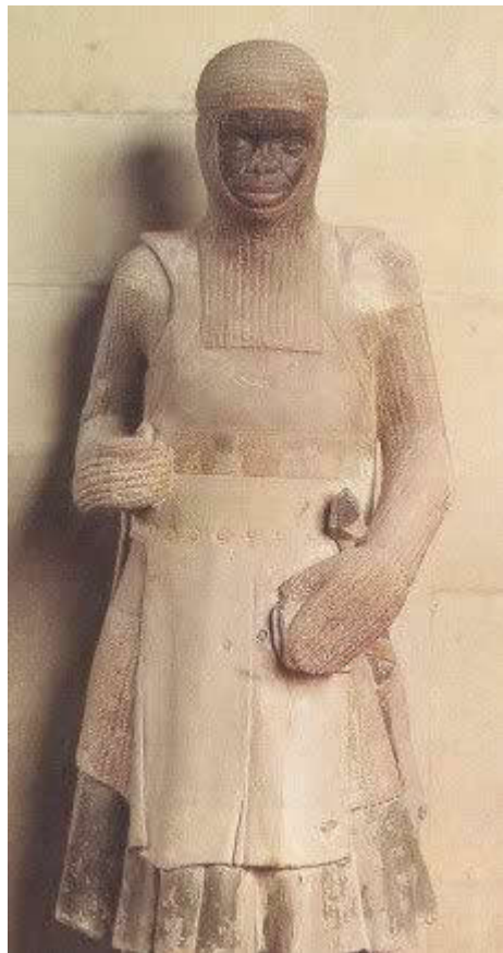
Statue de Saint Maurice, seconde moitié du XIIIe siècle